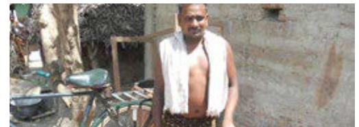
An income generating activity for a person with disability

Provided grant assistance to PwDs in renovating their thatch houses.