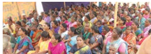
Self Help Groups Meeting