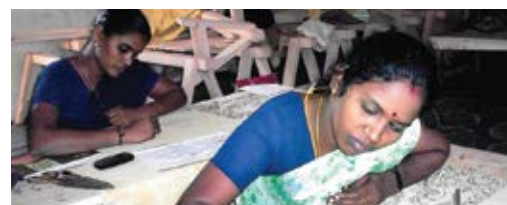
Kalamkari Art training