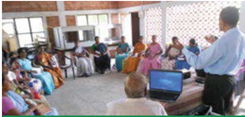
Leadership training to federation members