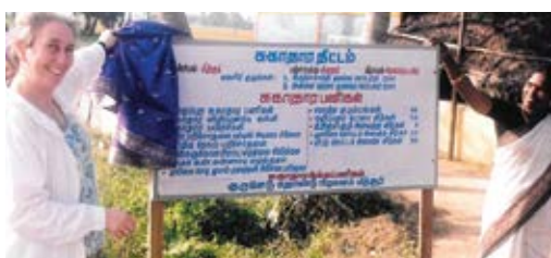
Display of health activities in a village