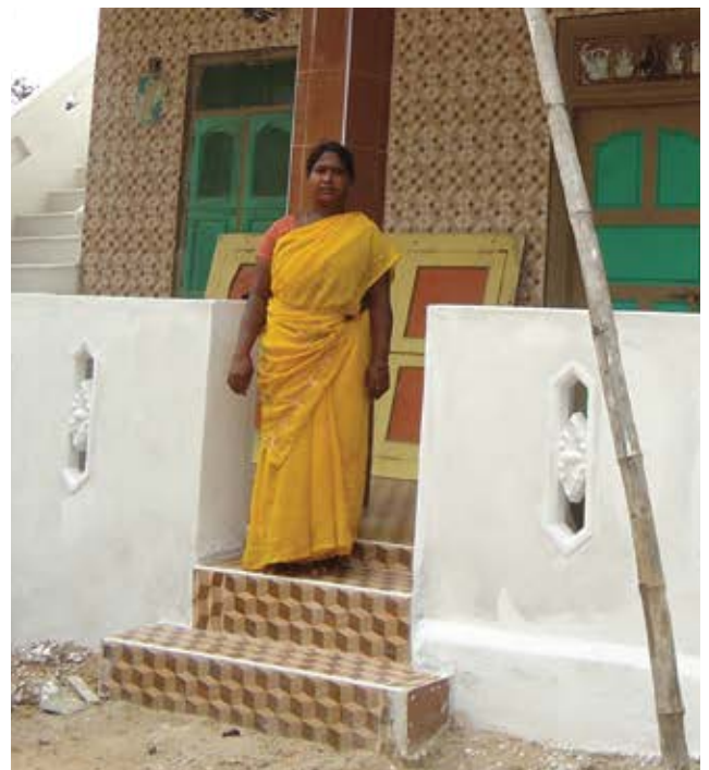
A house built with the support of Action Rural Housing

ARH has distributed CFL bulbs to all beneficiaries free of cost to reduce their power bills and also to create awareness on Global warming. ARH supplied insulin plants free of cost, consumption of which reduces the level of blood sugar. To encourage Kitchen Garden activity among women group members, ARH distributed vegetable seeds to shareholders at the 2014 AGM free of cost.