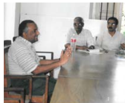
Exposure Visit to Kerala