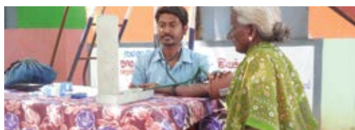
Medical care for the elderly women