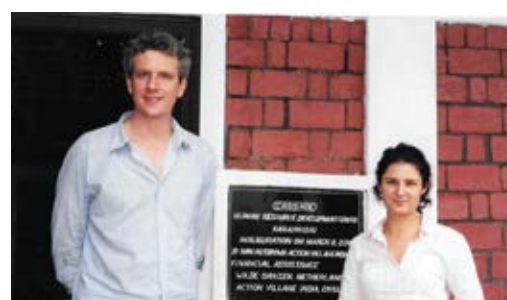
Volunteers from UK