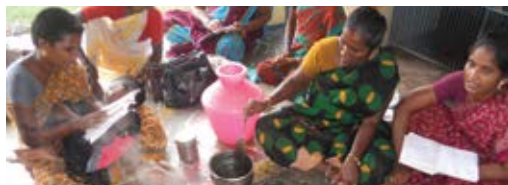
Demo of herb medicine preparation