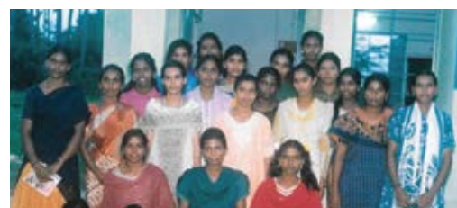
Adolescent Girls Training

Provided books, note books, uniform, school bags and education equipment to 334 students from poor families.