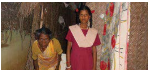
Educational support to poorest family

Provided medicines regularly to seven families for their chronic health problems.