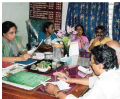
Exposure visit to West Bengal Panchayat Systems