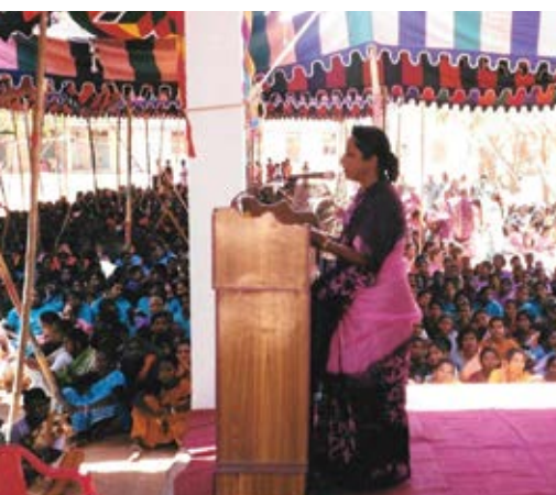
Organising the poor