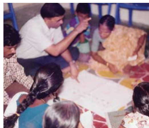
PRA Training by Gandhigram Rural University