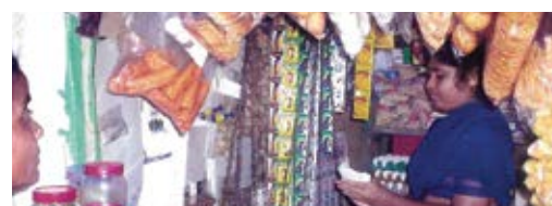
Income Generation Activity