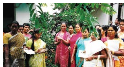
Exposure visit herbal projet