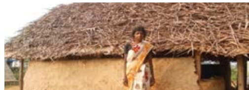
A new roof for Sarala

Addressing gender and caste discrimination at the grassroots level.